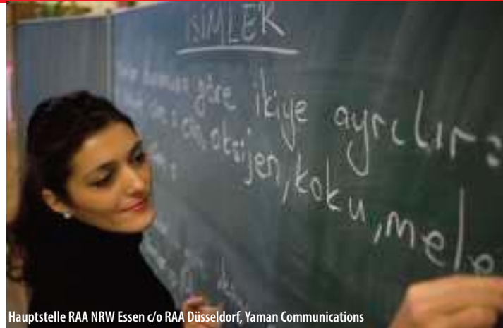
Hauptstelle RAA NRW Essen c/o RAA Düsseldorf, Yaman Communications